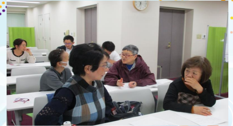
ヘルパー定例会の様子