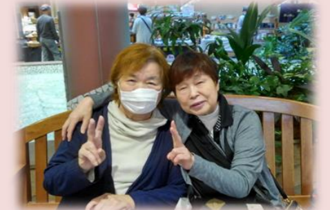
▲ご利用者様とお散歩へ

らいふホームマネジメントサービスは、専任スタッフ「らいふ執事」が、その名の通り皆様の執事として、ワンランク上のご要望にお応えするサービスです。サービスマンとして経験豊富なスタッフが皆様専任の「執事」として承ります。介護保険の枠にとらわれず、ご旅行の手配や外出同行等、幅広いサービスメニューを取り揃えております。